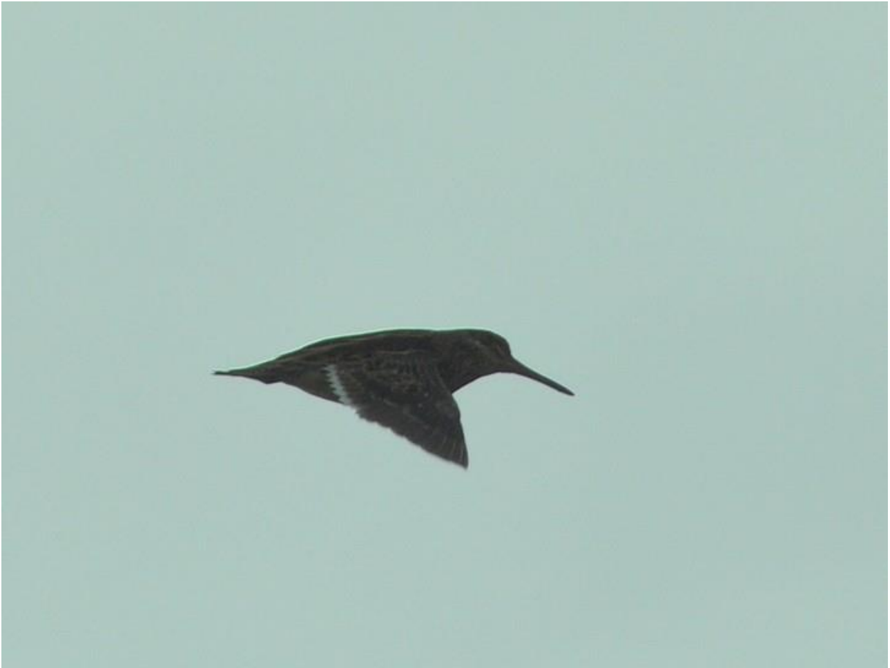
Bekasik – 03.05/Dolina Biebrzy