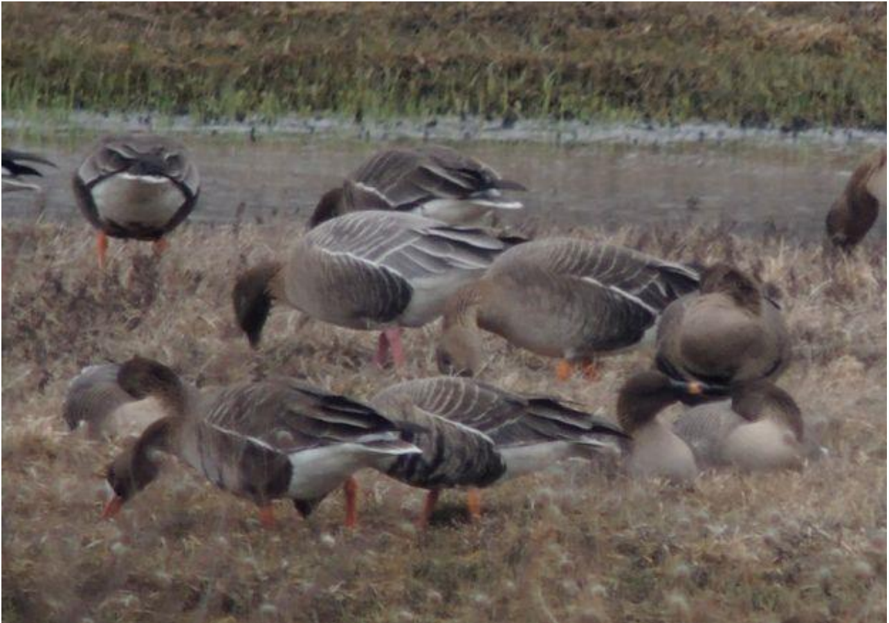
Gęś krótkodzioba – 07.03/Dolina Biebrzy