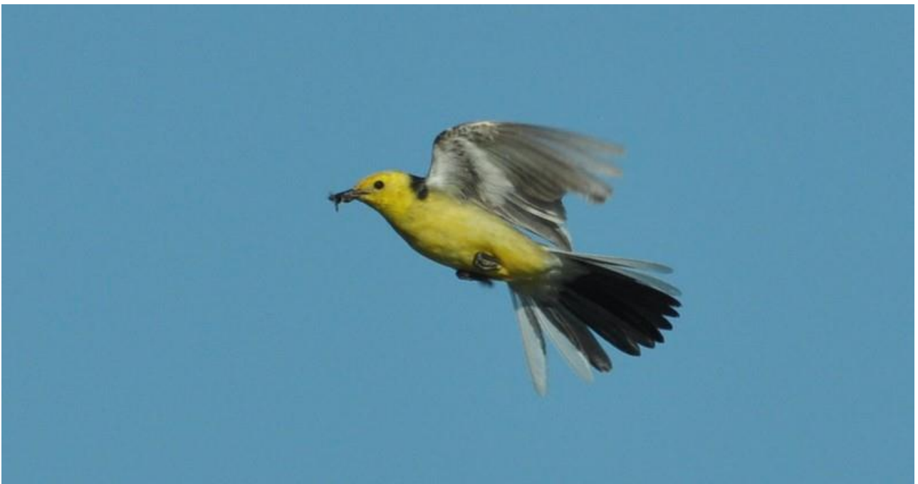
Pliszka cytrynowa – Dolina Biebrzy