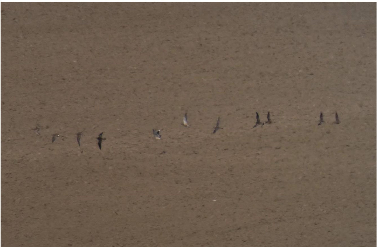
Mornel – 30.08/Krynki