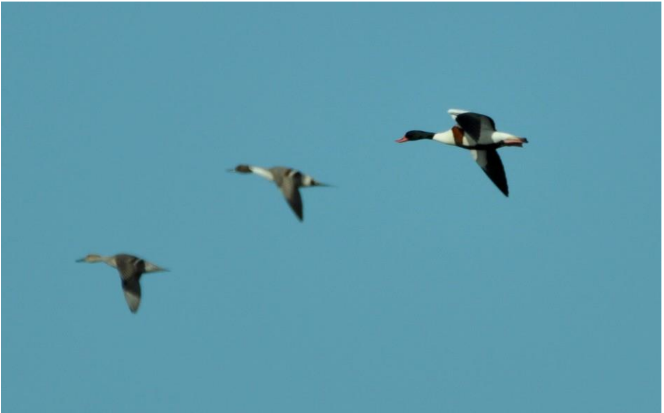
Ohar – 06.03/Dolina Biebrzy