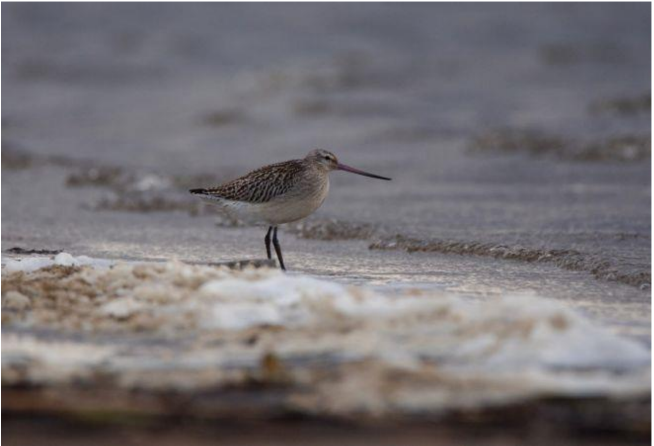
Szlammik – 02.10/Zb. Siemianówka