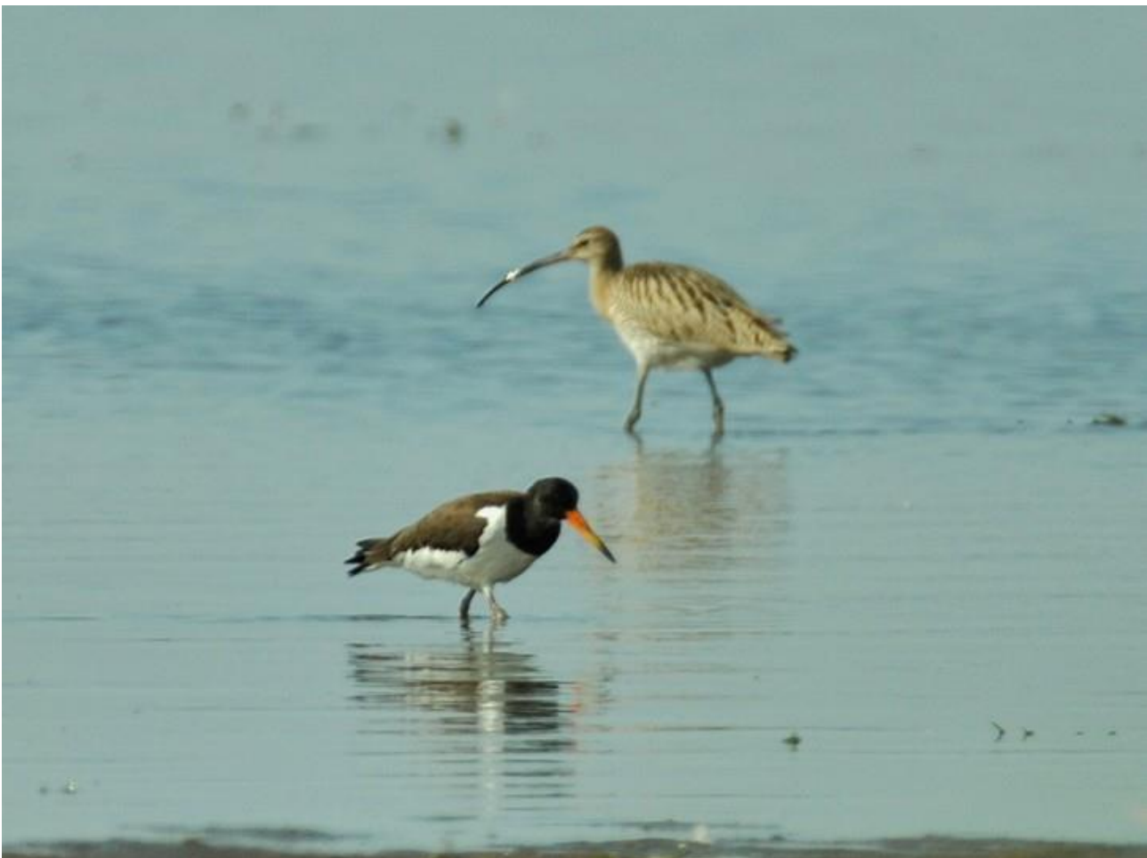
Ostrygojad – 31.08/Zb. Siemianówka