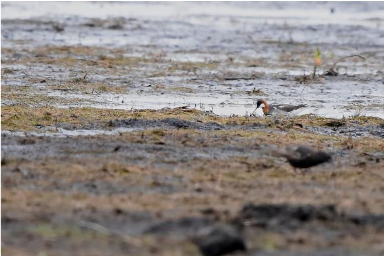
Płatkonóg sztyldzioby – 15.07/Zb. Siemianówka