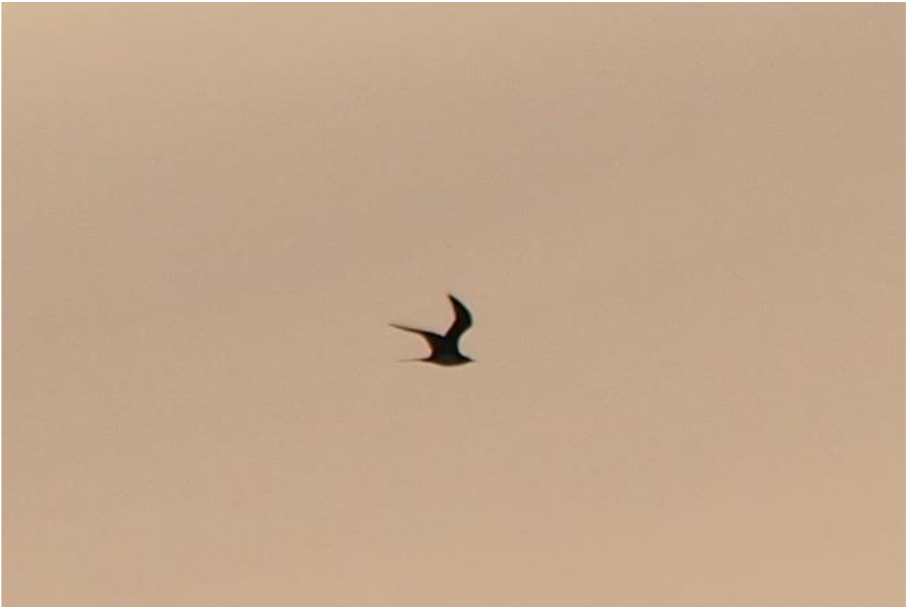
Wydrzyk ostrosterny – 06.05/Dolina Górnej Narwi