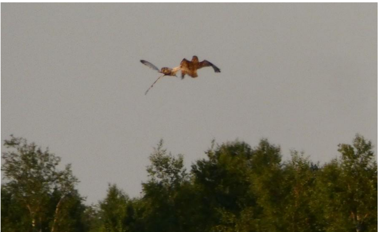
Uszatka błotna – 31.05/Dolina Biebrzy