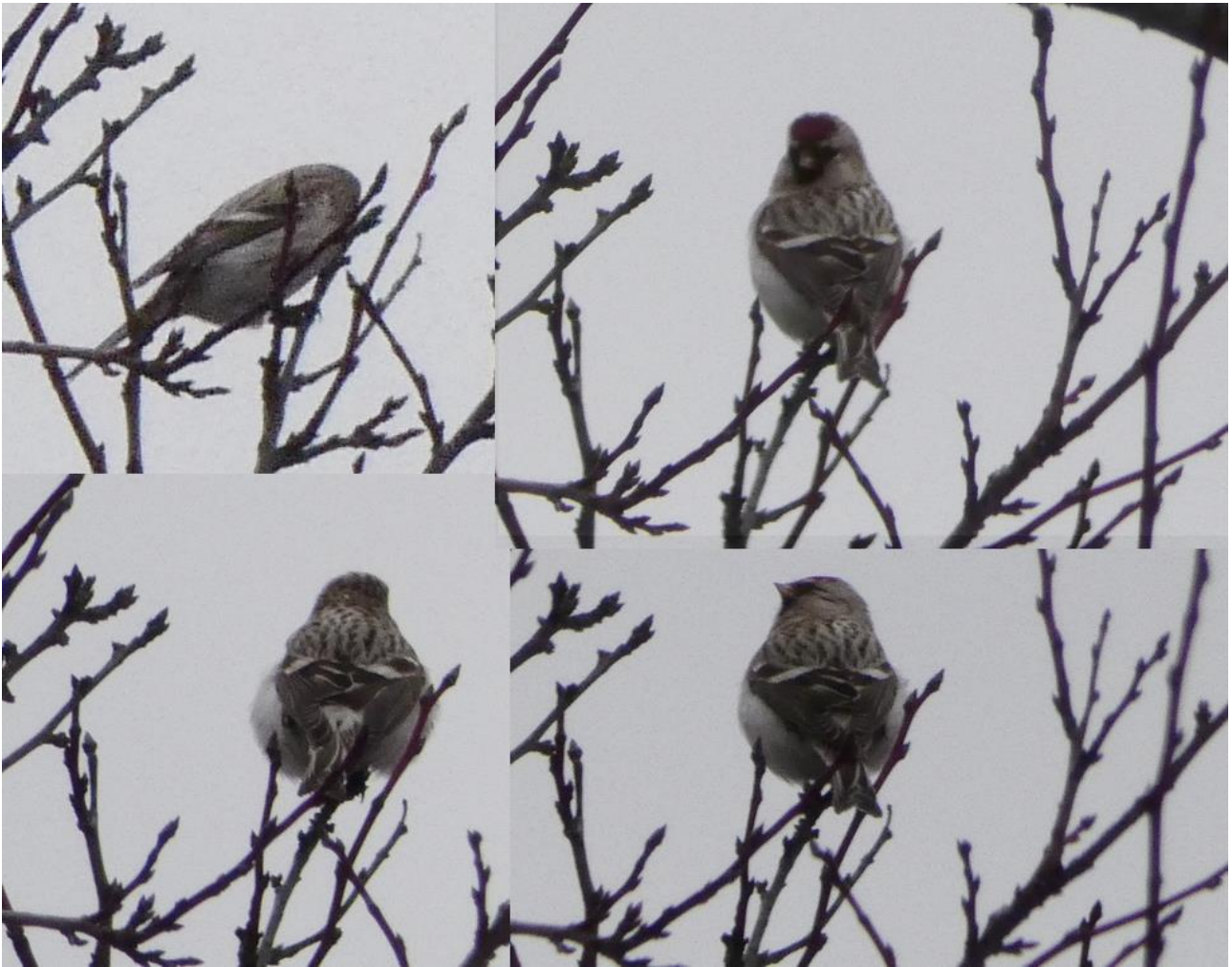
Czczotka tundrowa – 15.02/Sokółka