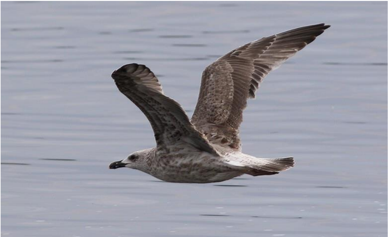
Mewa romańska – 09.08/Zb. Siemianówka