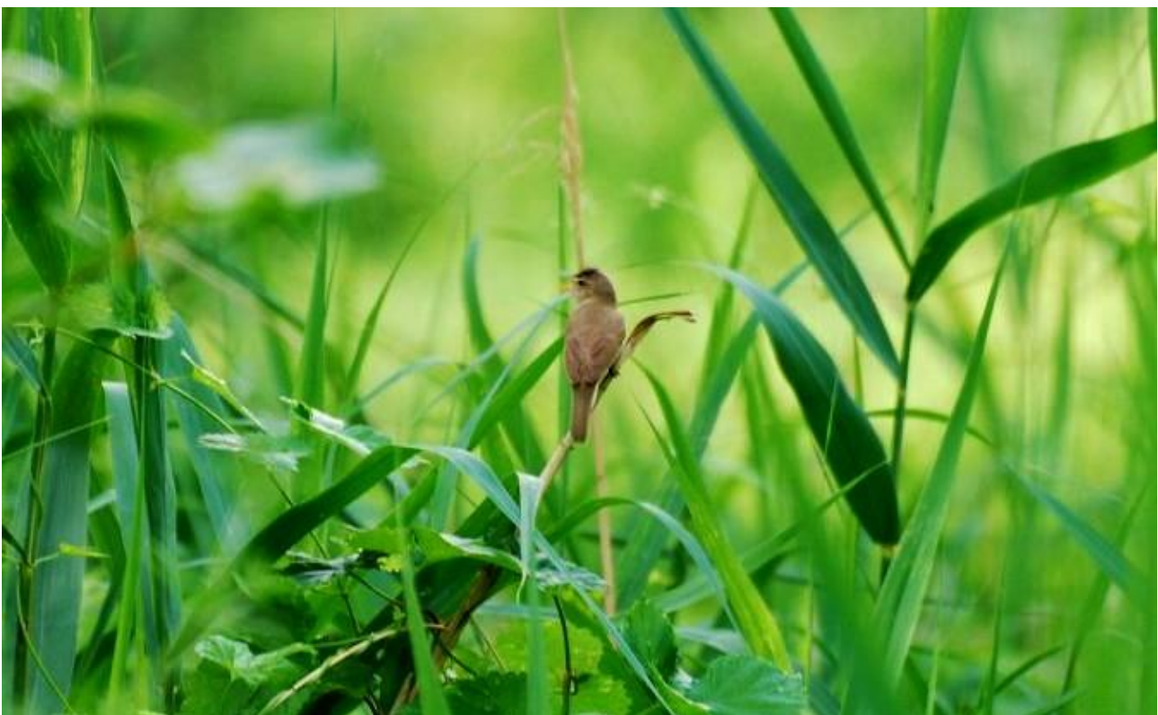
Zaroślówka – 14.06/Sobolewo

Czerwoną czcionką zaznaczono obserwacje podlegające weryfikacji Komisji Faunistycznej, które nie posiadają jeszcze wymaganej akceptacji.