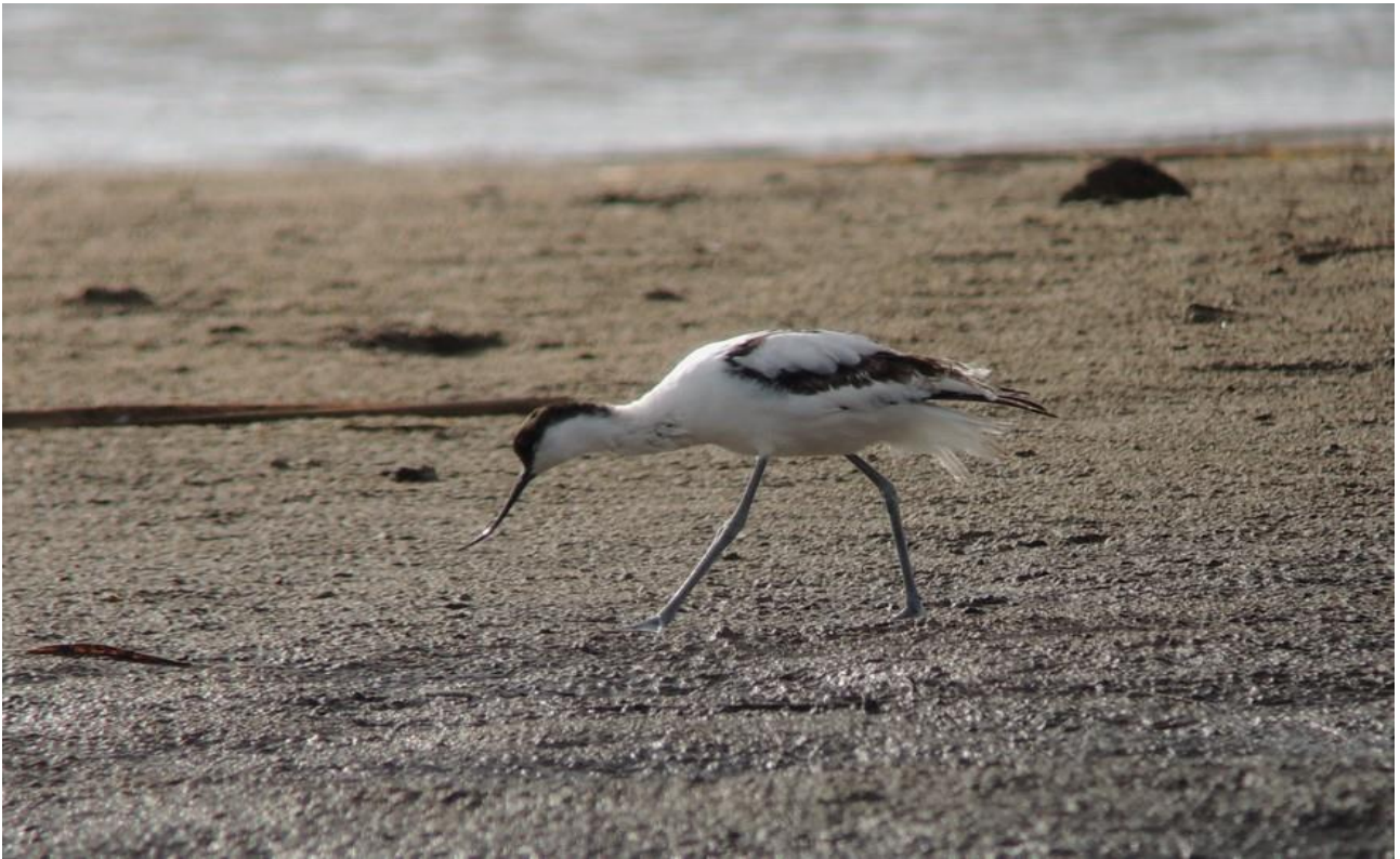
Szablodziób – 18.09/Zb. Siemianówka