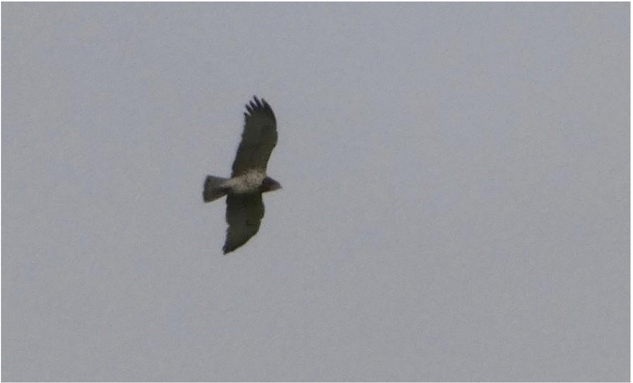
Gadożer – 13.05/rz. Brzozówka