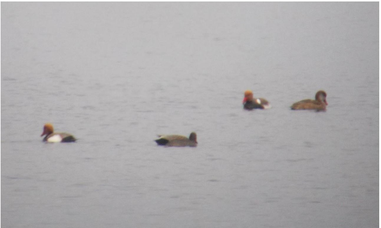
Helmiatka – 29.03/Dolina Biebrzy