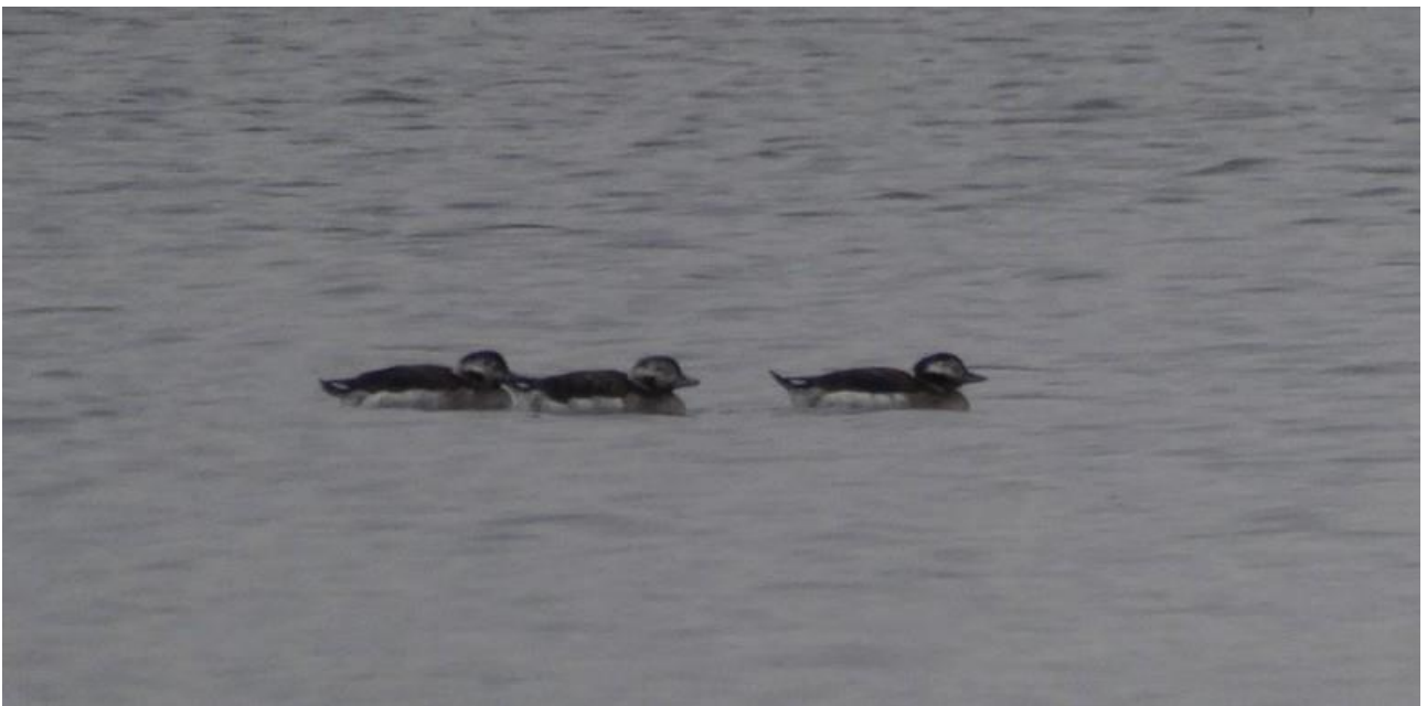
Lodówka – 01.12/Stawy Dojlidzkie