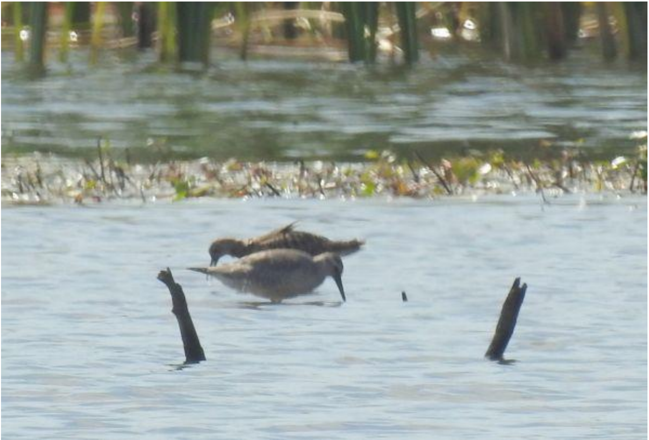
Biegus rdzawy – 31.08/Zb. Siemianówka