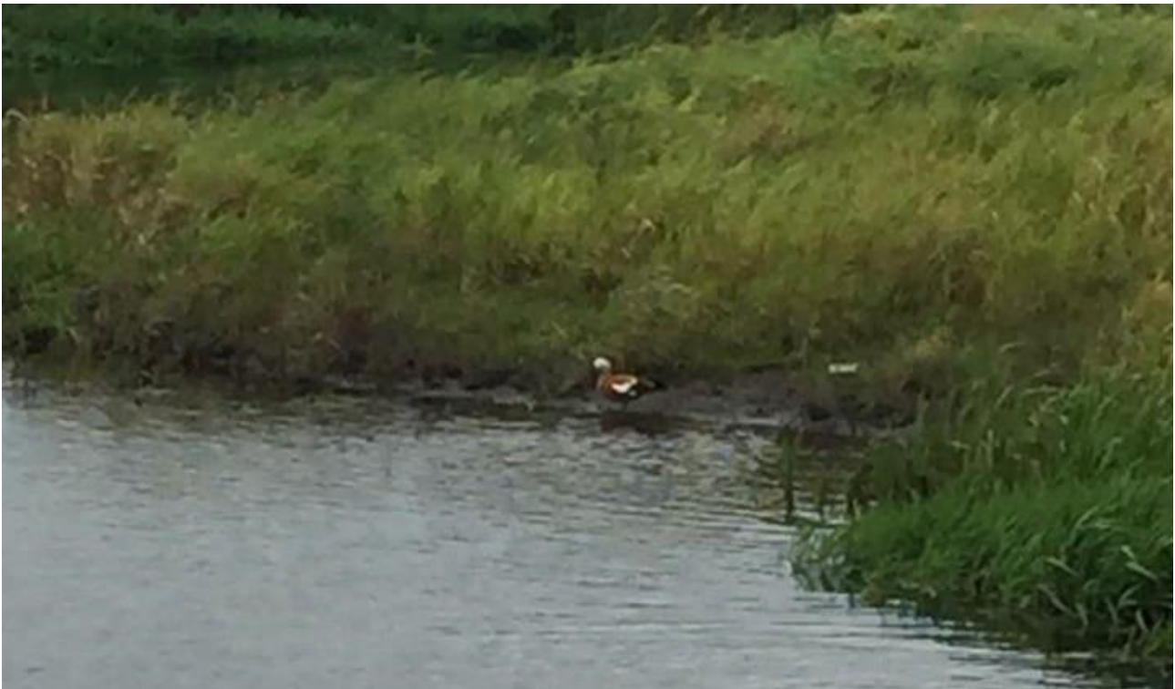
Kazarka rdzawa – 11.10/rz. Supraśl-Dzikie