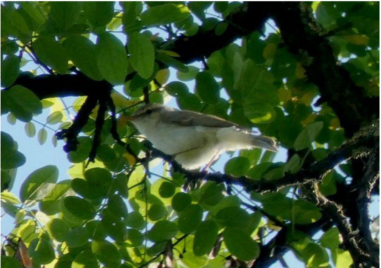
Wójcik – 05.06/Białystok