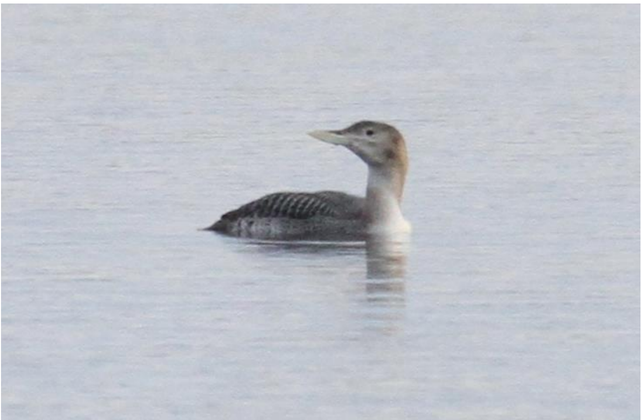
Nur białodzioby – 29.12/Jez. Wigry