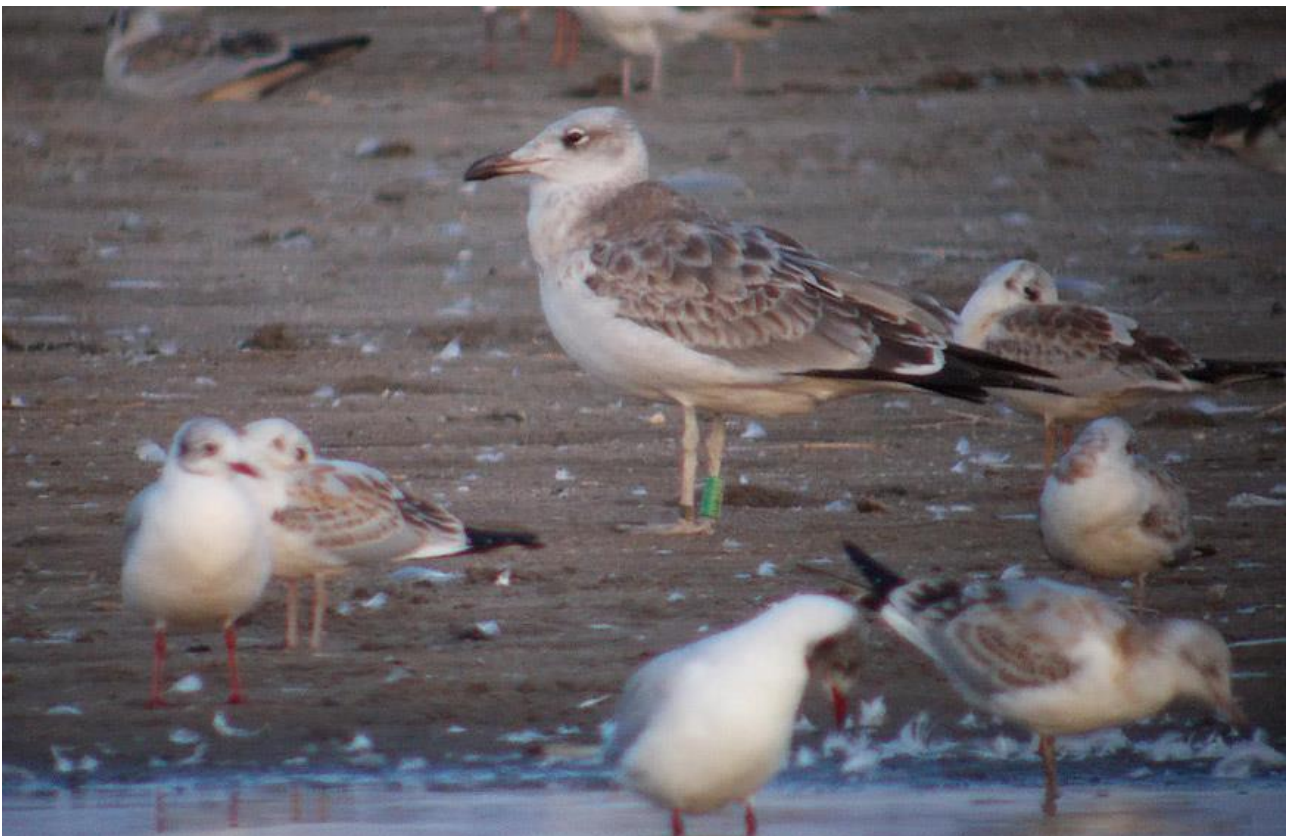
Orlica – Zb. Siemianówka