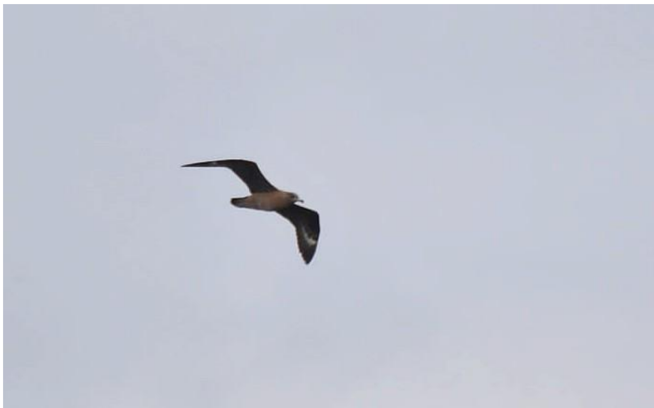
Wydrzyk wielki – 17.09/Zb. Siemianówka

17.06 – 56 par, gn. pewne, Zb. Siemianówka (T. Tumieli, G. Grygoruk)