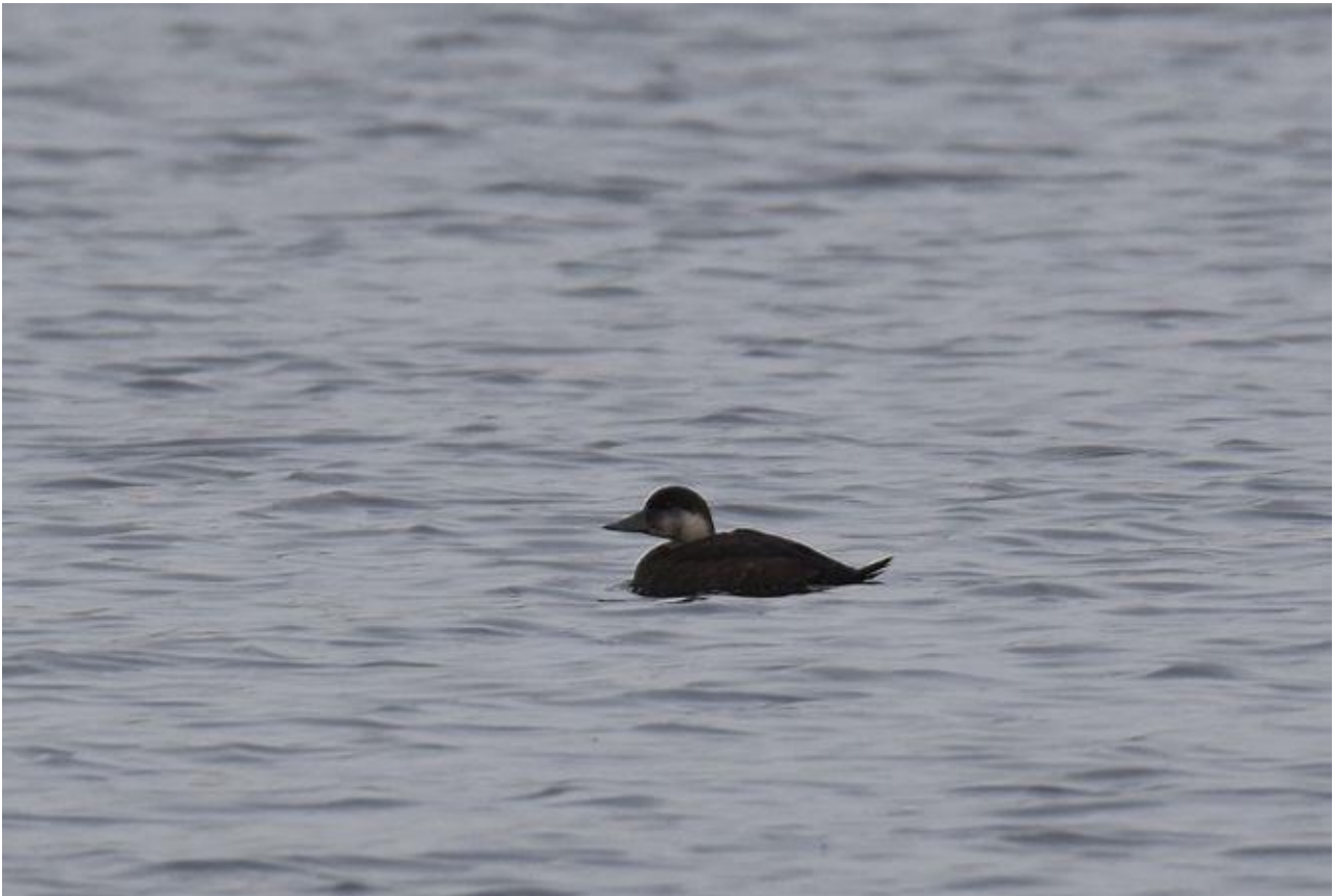
Markaczka – 02.11/Stawy Dojlidzkie