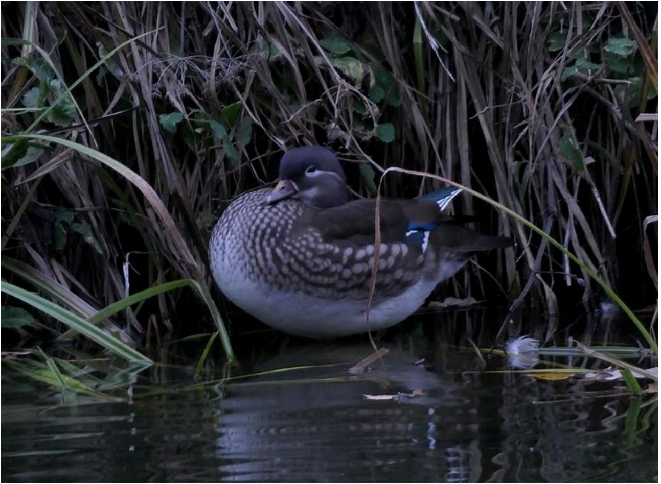
Mandarynka – 27.10/Białystok