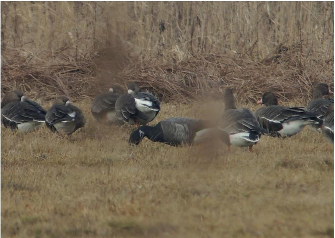
Bernikla obrożna – 28.02/Bagno Wizna