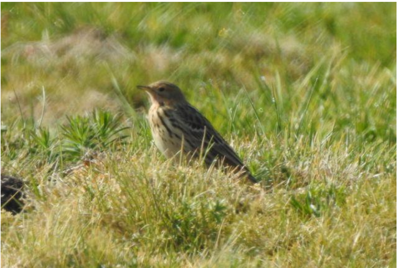
Świergotek rdzawogardły – 12.05/Dolina Biebrzy