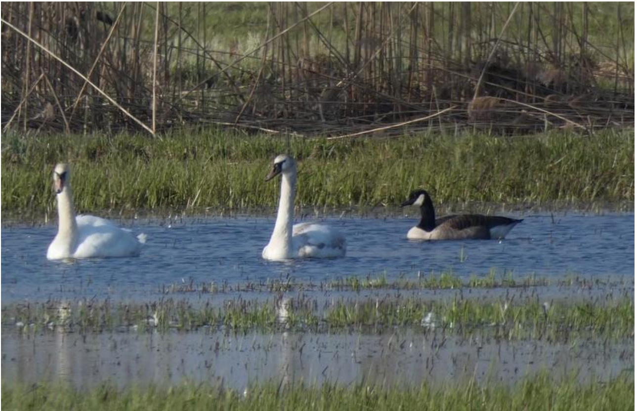
Bernikla kanadyjska – 06.04/Dolina Górnej Narwi