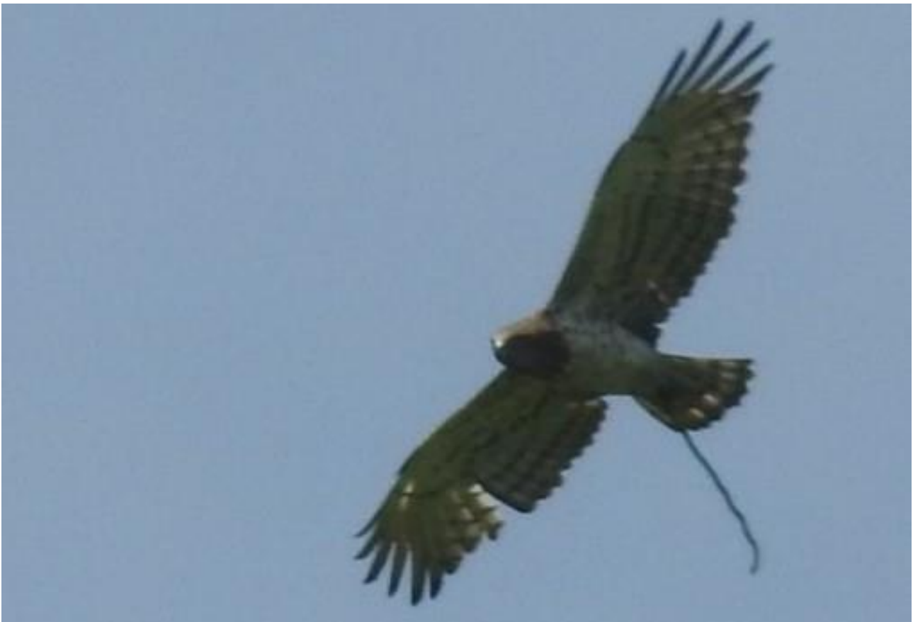
Gadożer – 10.06/Dolina Biebrzy