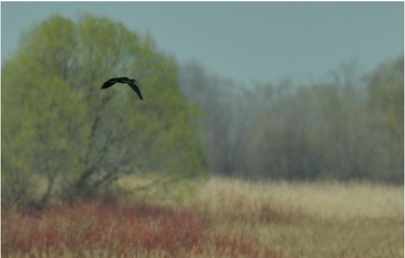
Ibis kasztanowaty – 09.04/Dolina Biebrzy