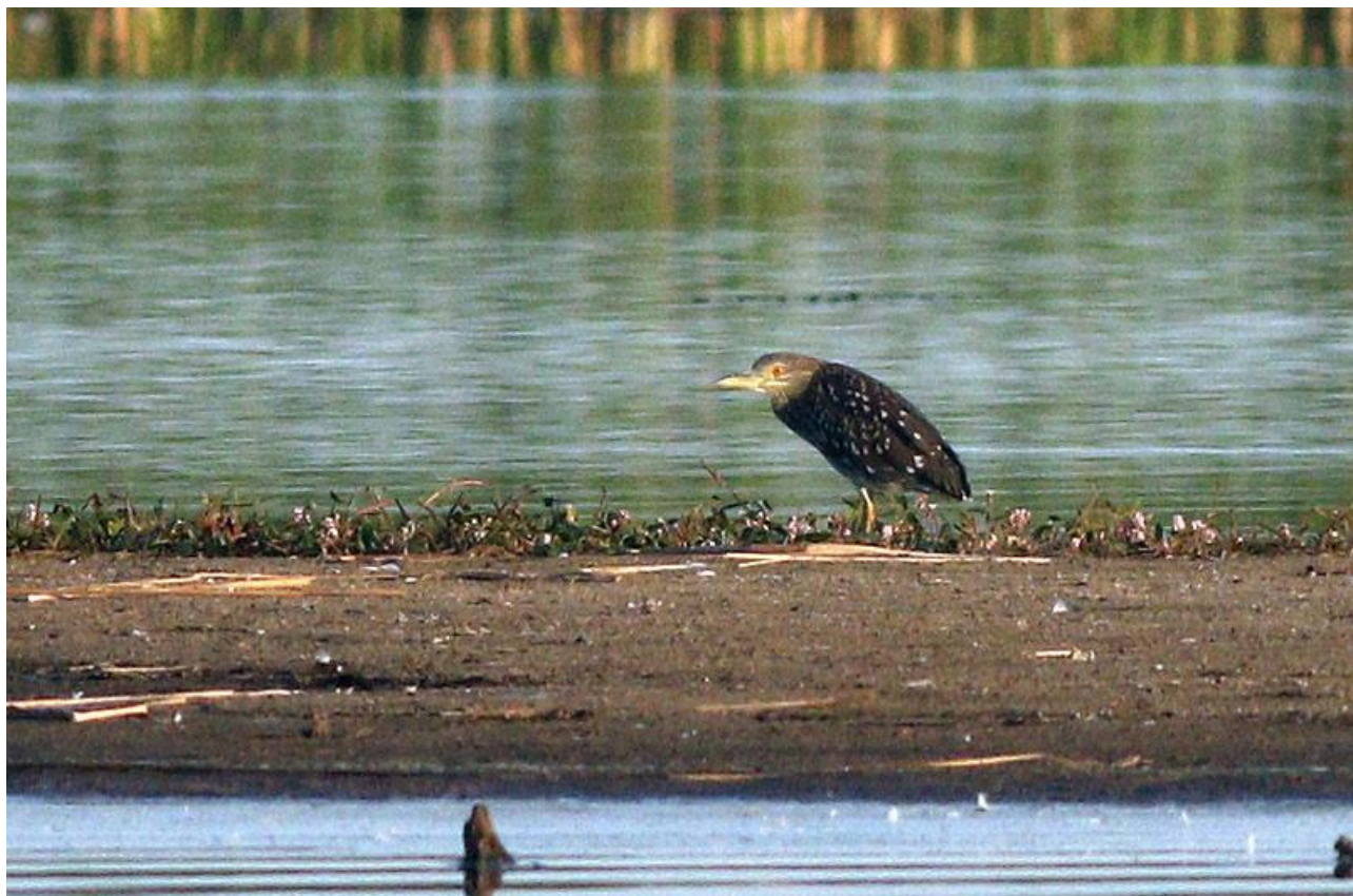
Ślepowron – 23.08/ Zb. Siemianówka

02.11 – 228, Zb. Siemianówka (Ł. Krajewski, A. Henel)