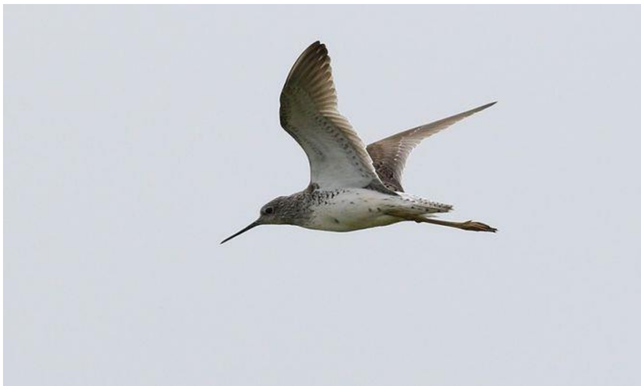
Brodziec pławny – 11.05/Dolina Biebrzy

15.07 – 1 ad., Zb. Siemianówka (M. Rowicki) 01.08 – 1, Zb. Siemianówka (R. Szczęch, W. Wichrowski) 02.08 – 1 ad., Zb. Siemianówka (G. Grygoruk) 06.-07.08 – 1 juv, Zb. Siemianówka (A. i C. Meisser i inni) 16.08 – 1 juv., Zb. Siemianówka (M. Polakowski i inni) 30.08-05.09 – 1 juv., Zb. Siemianówka (T. Tumiel, G. Grygoruk)