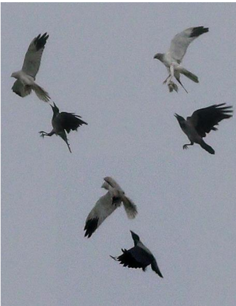
Błotniak stepowy