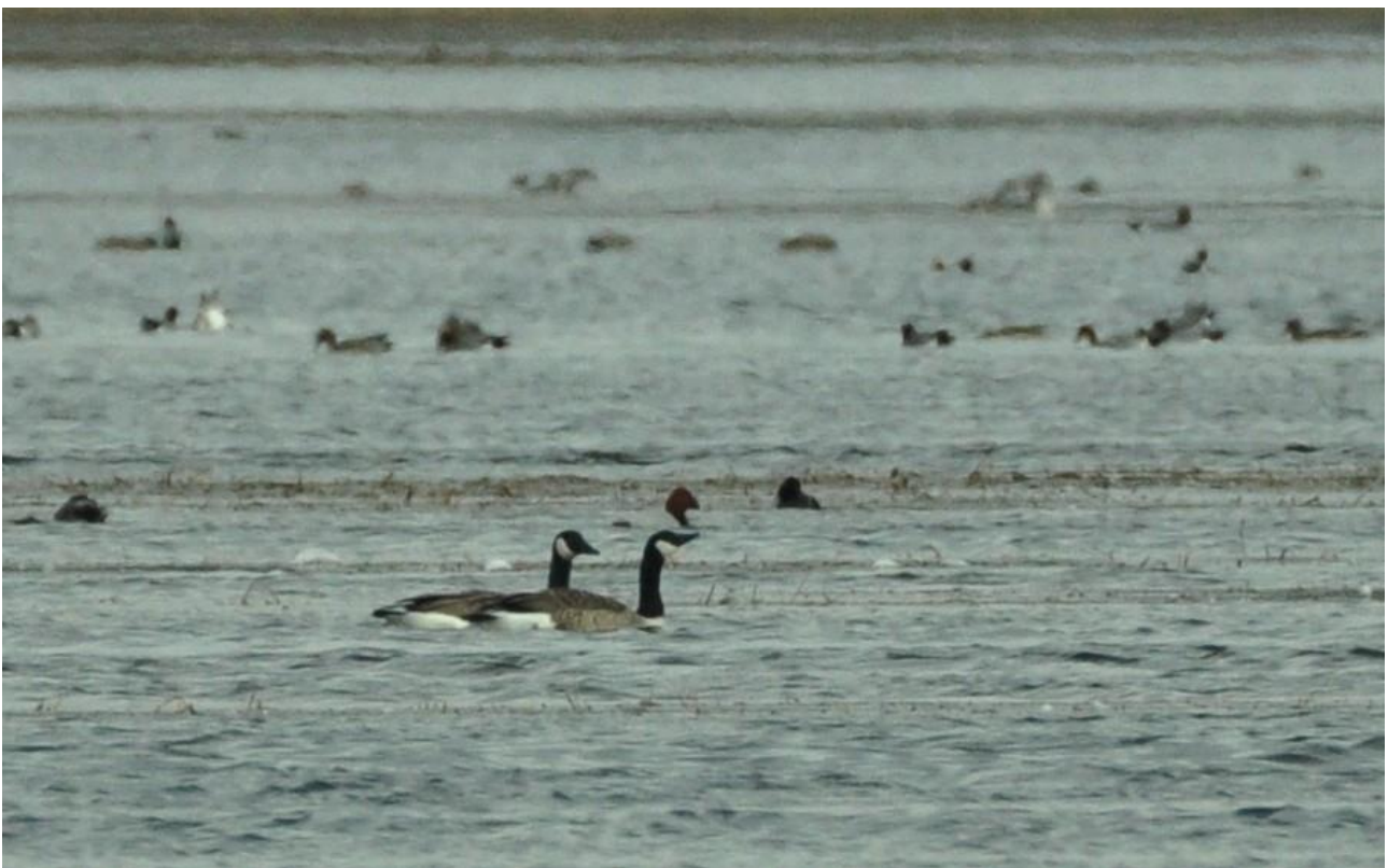
Bernikla kanadyjska – 06.03/Dolina Biebrzy