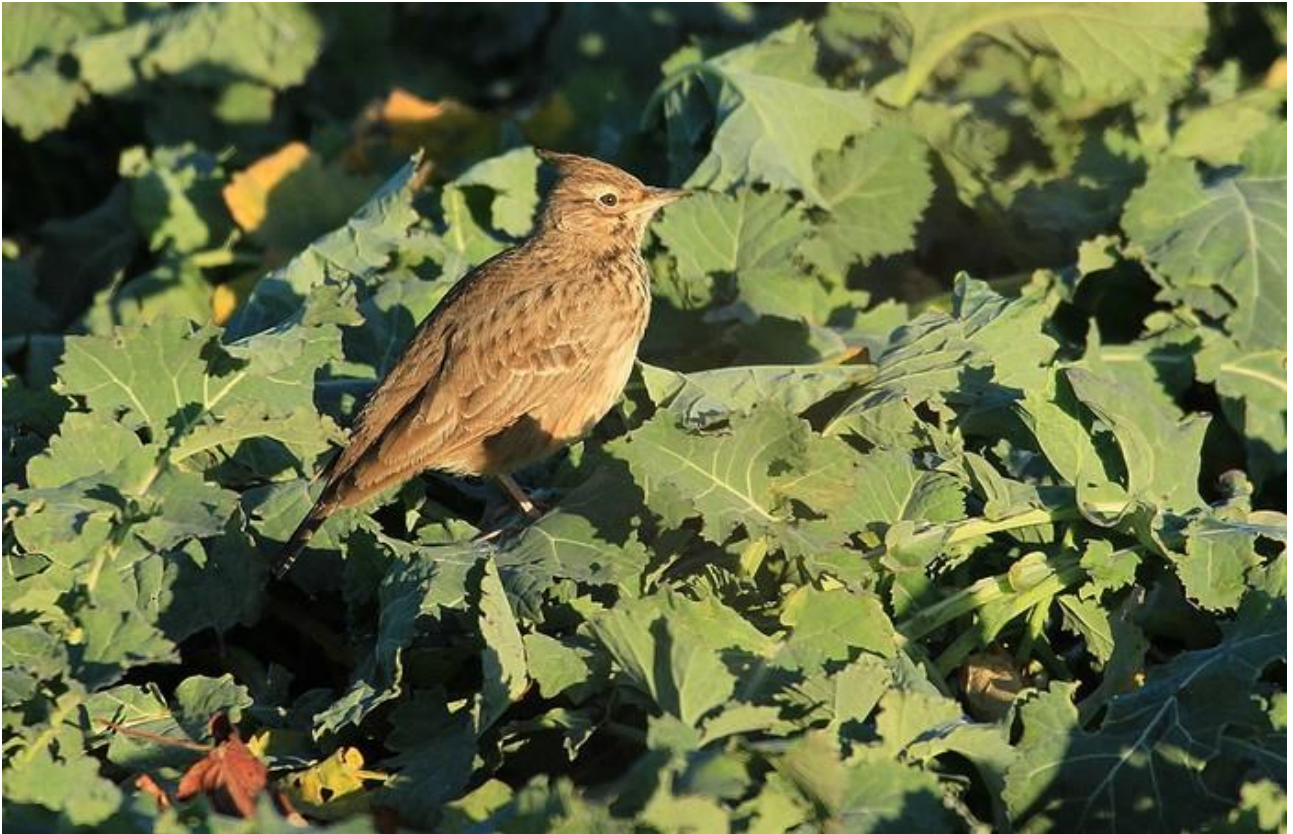
Dzierlatka – 29.12/Krynki