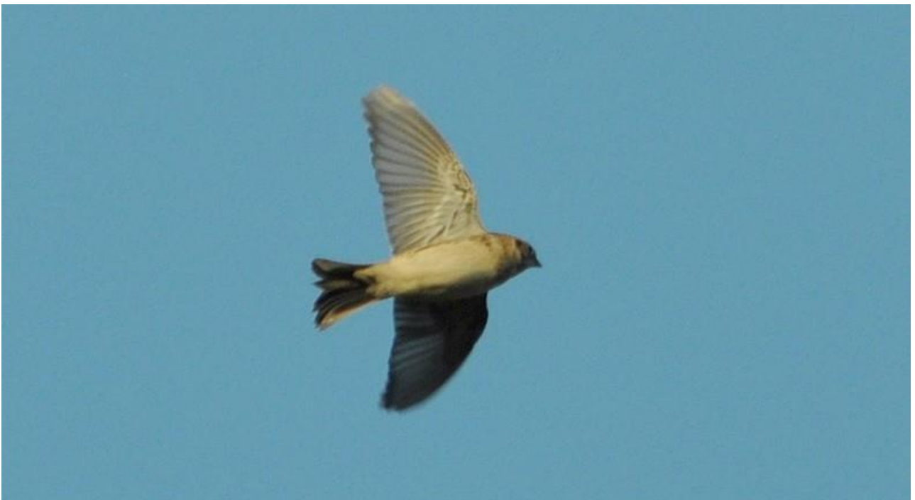
Poławierka – 24.11/Goniądz