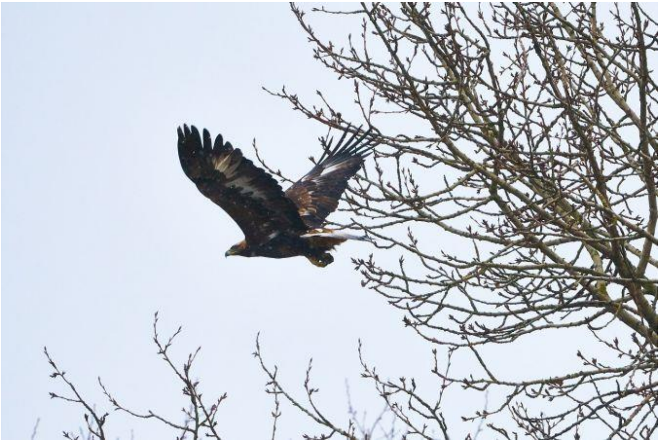
Orzeł przedni – 13.02/Boćki