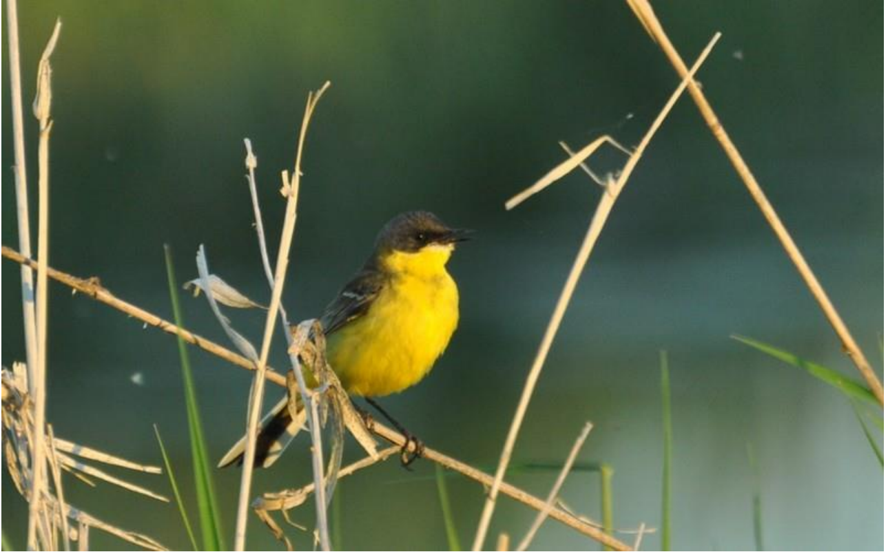
„Pliszka tundrowa” – 30.05/Dolina Biebrzy