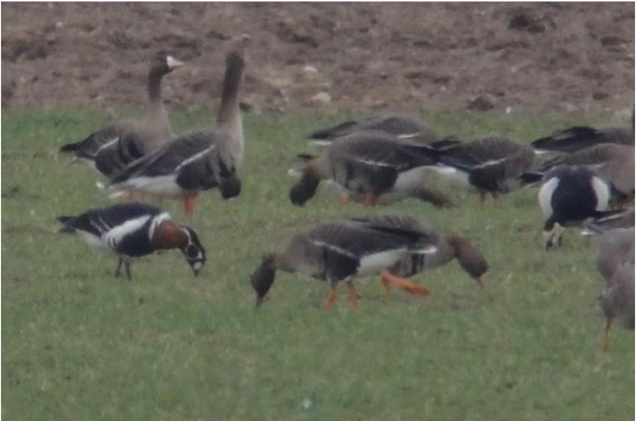
Bernikla rdzawo szyja – 07.03/Dolina Biebrzy