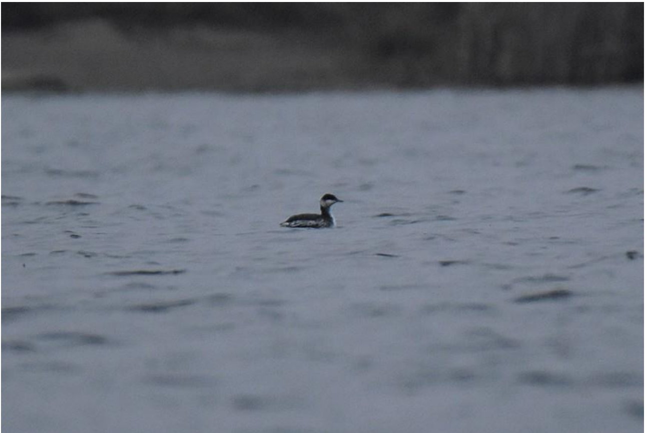
Perkoz rogaty - 25.11/Zb. Siemianówka