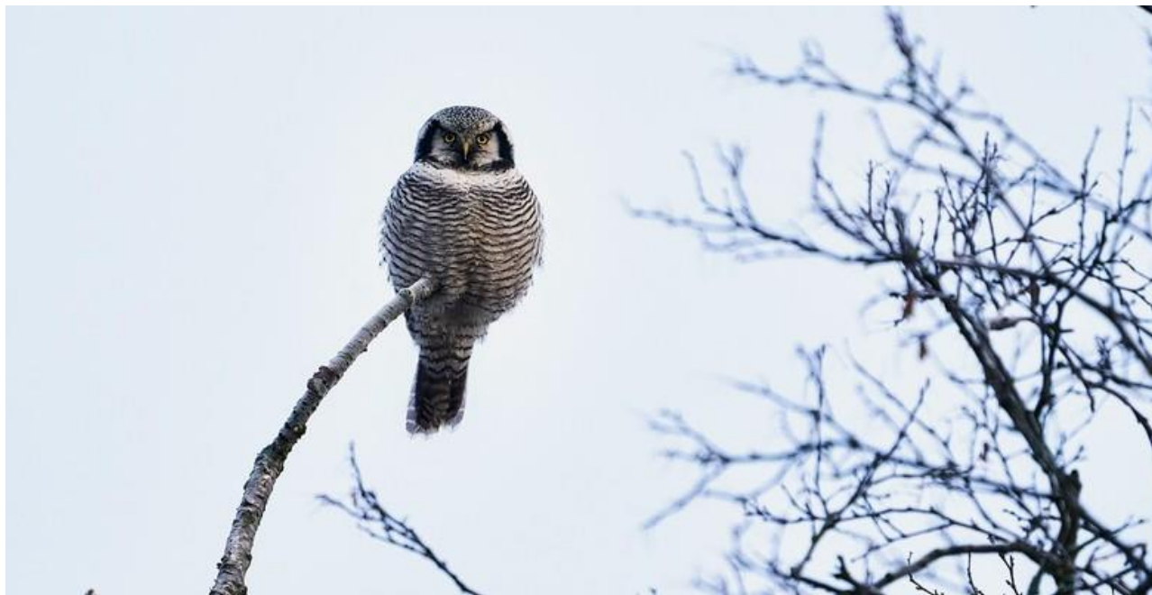
Sowa jarzębata – 09.02/Leonowicze