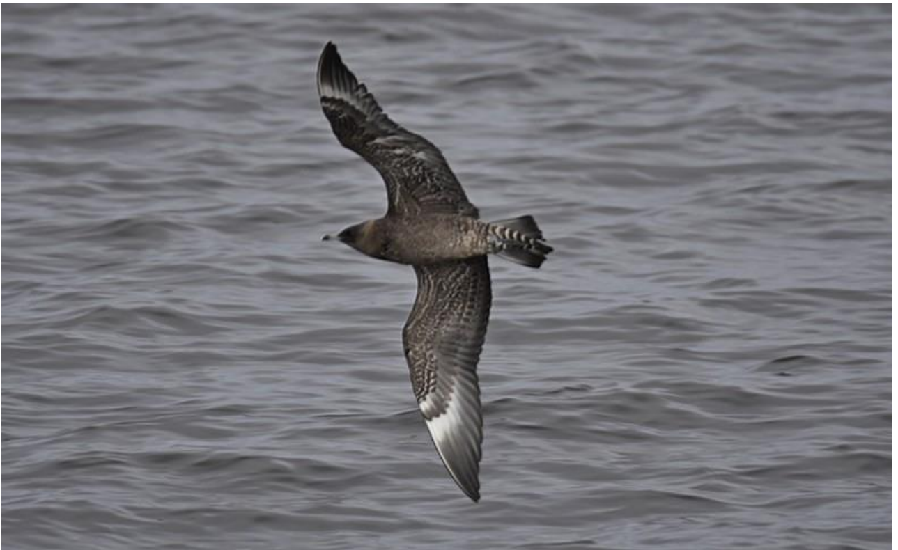
Wydrzyk tęposterny – 29.10/Zb. Siemianówka