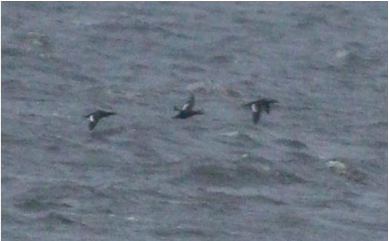
Uhla – 21.11/Zb. Siemianówka