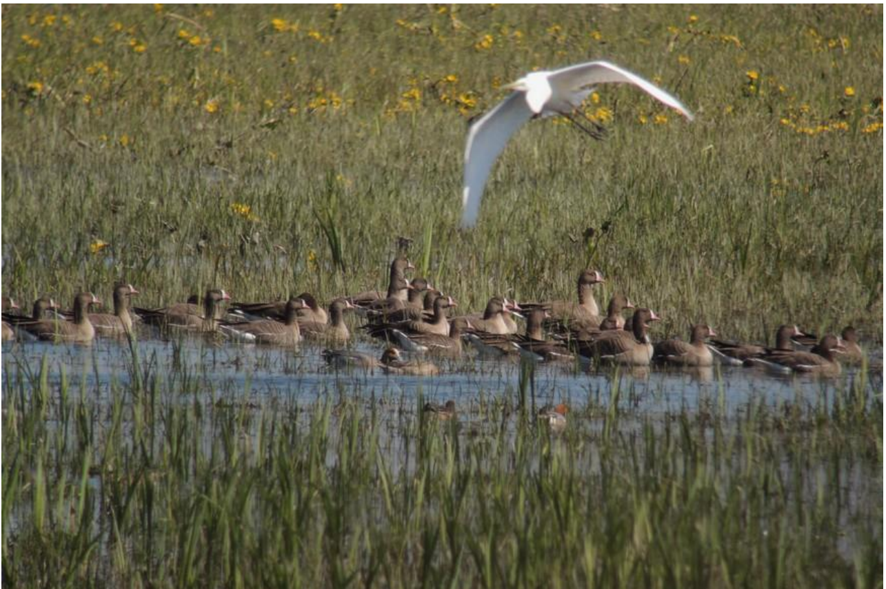
Gęś mała – 17.04/Dolina Biebrzy