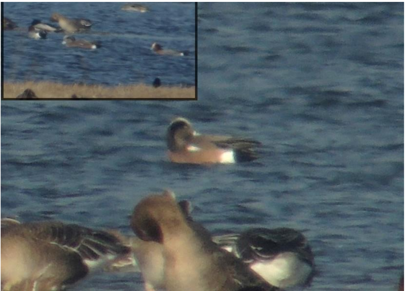
Świstun amerykański – 28.02/Dolina Narwi-Góra Strękowa