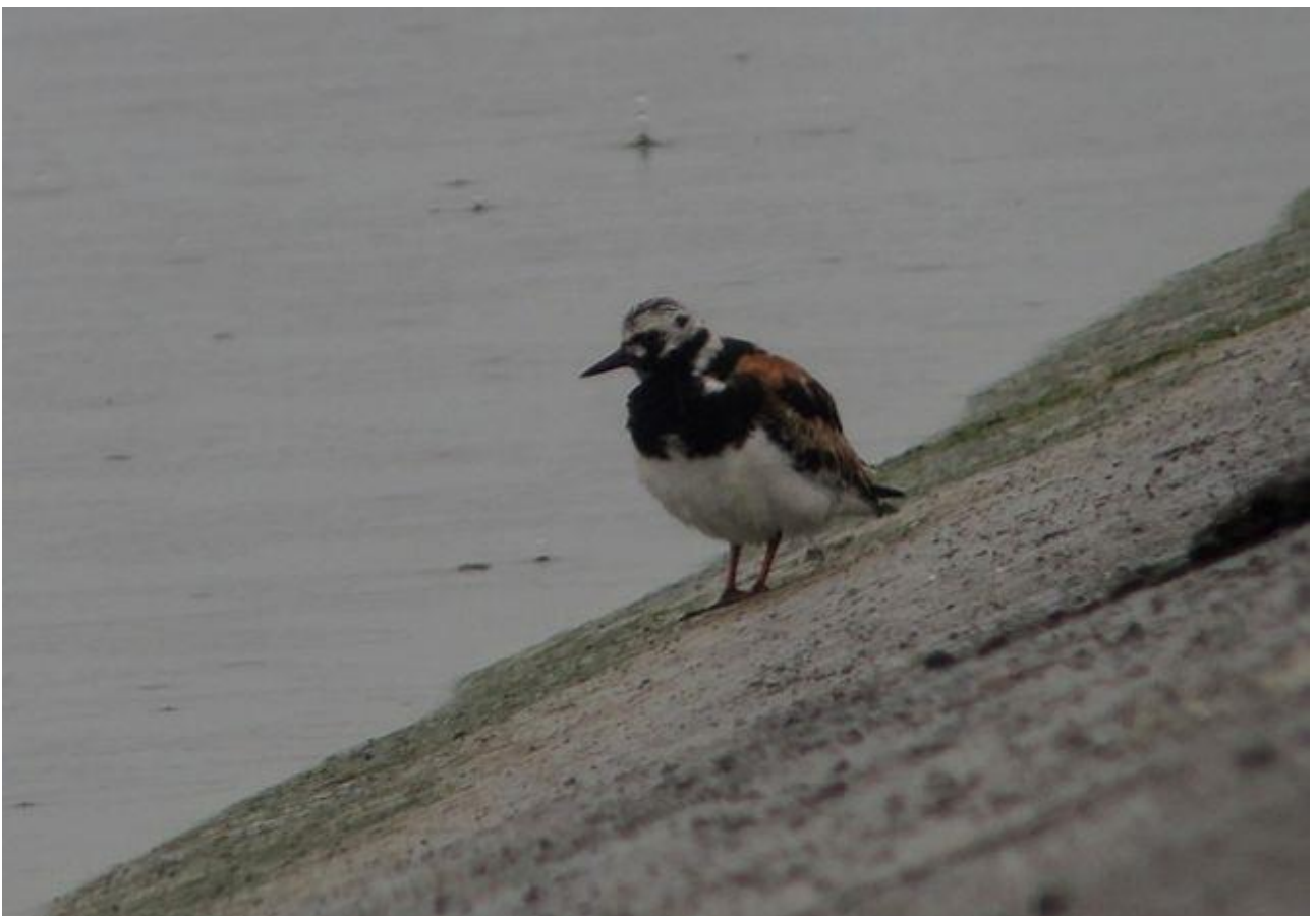
Kamusznik – 14.08/Zb.Siemianówka