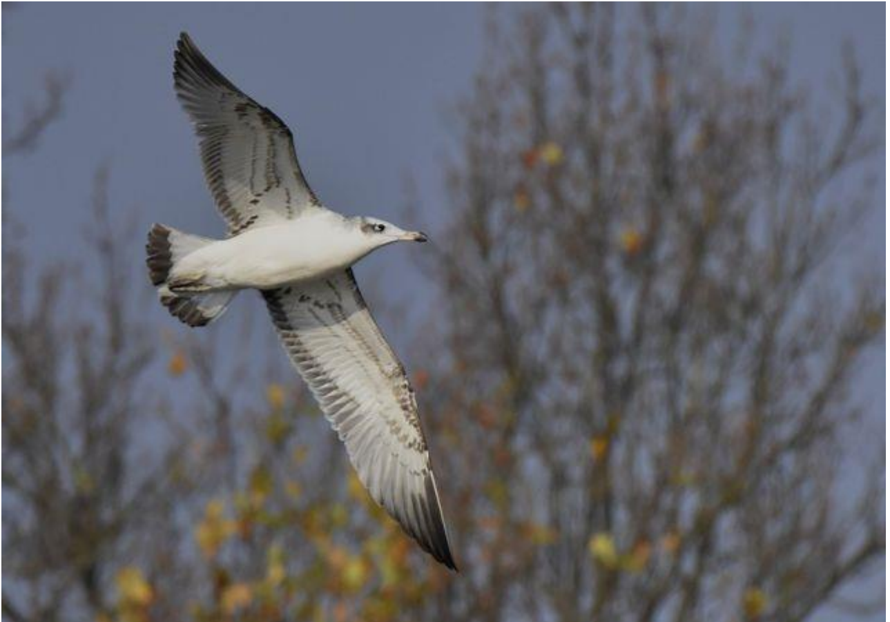
Orlica – Stawy Knyszyn-Zamek